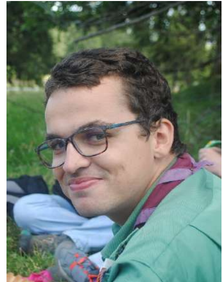
Co-Responsable de Groupe Barasingha