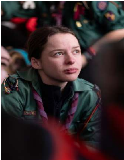
Co-Responsable de Groupe Belette