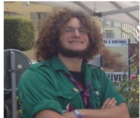
Resp. Gros matériel (QM) Agami