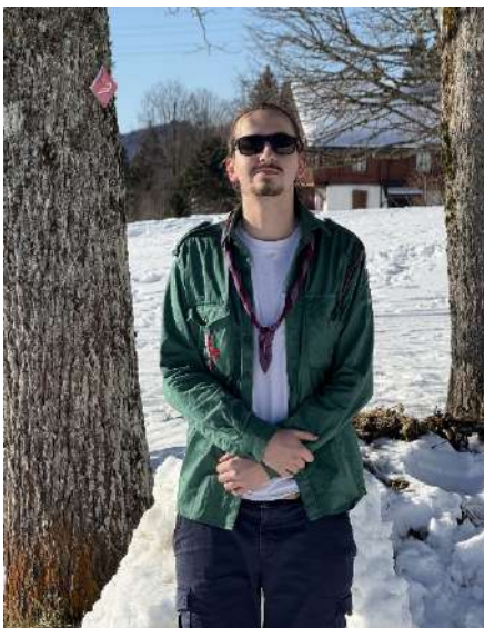
Resp. Petit matériel (QM) Alpaga